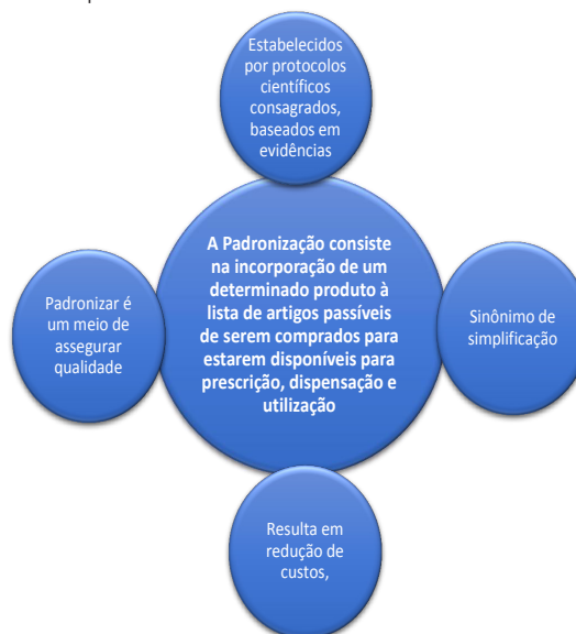
Figura 1. Por que Padronizar?

Neste instrumento, padronizamos 639 medicamentos, distribuídos em 18 grupos terapêuticos, 95 medicamentos do Estado do Tocantins padronizados no componente especializado a assistência farmacêutica, distribuídos em 02 grupos, 882 materiais distribuídos também em 17 grupos, 54 dietas, suplementos e fórmulas adultos, infantis padronizados na rede hospitalar do estado, distribuídos em 5 grupos, assim como 16 fórmulas nutricionais especiais fornecidas pela Diretoria de Assistência Farmacêutica Estadual a paciente domiciliados, contemplados pela Resolução CIB nº 315/2013, distribuídos em 3 grupos que cobrem as necessidades das Unidades Assistenciais e para bom atendimento a cada paciente usuário do SUS no Tocantins.